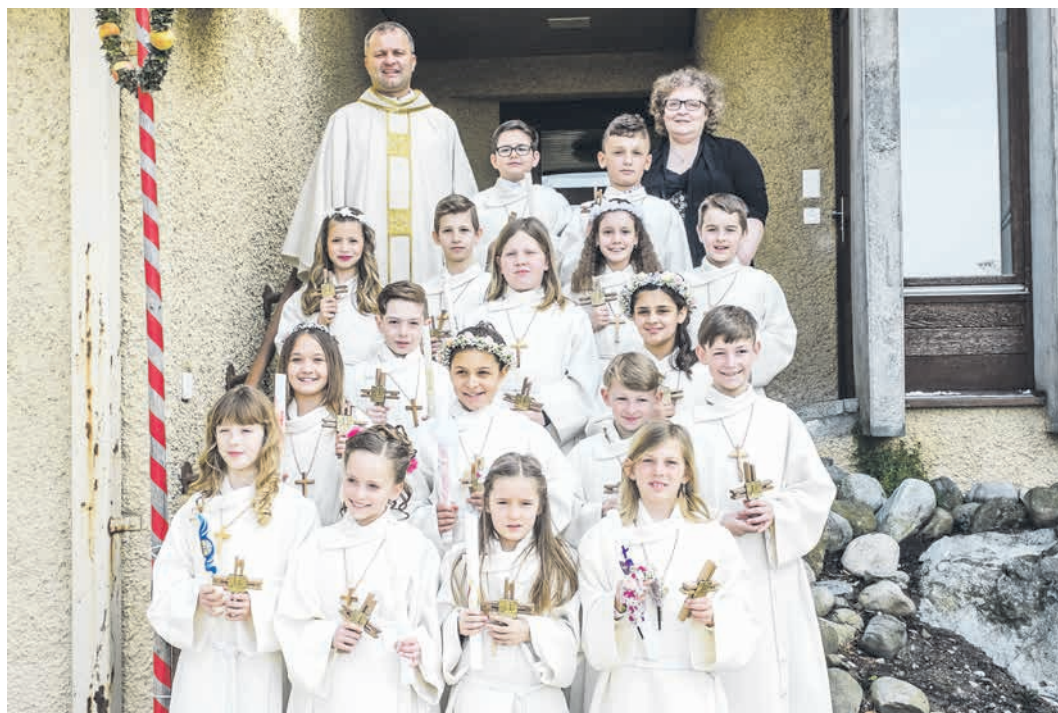
Erstkommunion vom Sonntag, 8. April in Menziken