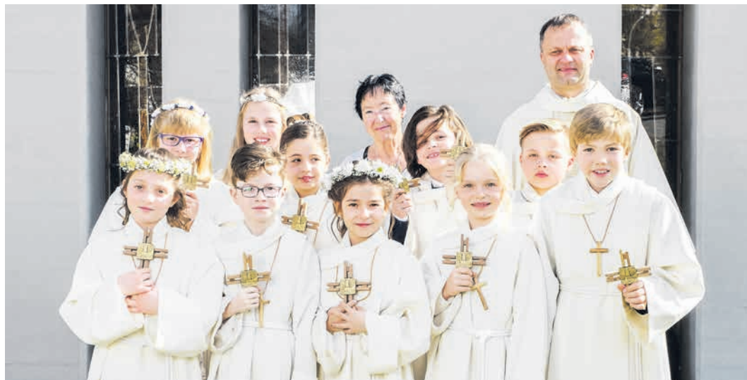
Erstkommunion vom Sonntag, 8. April in Beinwil am See