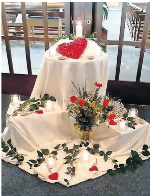
Pfarrkirche Aristau am Muttertag 2020

Wir freuen uns, mit Ihnen wieder Gottesdienste feiern zu dürfen. Trotz aller Lockerungsmassnahmen des Bundesrates gelten nach wie vor die Abstands- und Hygienevorschriften und die Empfehlung bezüglich Risikogruppen des Bundes. So appelliert das Pfarramt an die Selbstverantwortung jedes Gottesdienstbesuchers. Beim Zutritt der Kirche bitten wir Sie, am Eingang die Hände zu desinfizieren. Für die nötige Distanz sind die reduzierten Sitzplätze in der Kirche klar gekennzeichnet. Personen aus dem selben Haushalt dürfen zusammen sitzen. Die Kirchengesangbücher werden durch Liedblätter ersetzt und deshalb wird der Gemeindegesang auf ein Minimum reduziert. Wir bitten die Besucherinnen und Besucher den Weisungen der Mitarbeitenden zu folgen. Pfarramt und Kirchenpflege