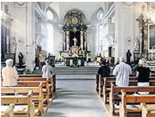
Bild vom 28.05.2020: Die Abstandsvorschrift (Familien dürfen zusammensitzen) wird eingehalten.

Es freut uns sehr, dass wir seit dem 28. Mai 2020 wieder öffentliche Gottesdienste feiern dürfen. Die Gottesdienste werden jedoch bis auf weiteres unter behördlichen Auflagen stattfinden müssen. Wegen des notwendigen Abstandes sind die Plätze in den Kirchen beschränkt. So hoffen wir auf Ihr Verständnis für die teils massiven Einschränkungen. Nach wie vor gelten die Abstands- und Hygienevorschriften und die Empfehlungen bezüglich Risikogruppen des Bundes. So appellieren wir an die Selbstverantwortung jedes Gottesdienstbesuchers, die eigene Gefährdung angemessen einzuschätzen.