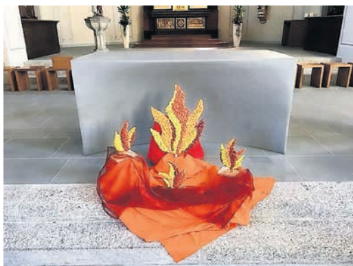
Pfingstgottesdienst in Bünzen

Nun freuen wir uns, dass wir wieder gemeinsam Gottesdienste feiern können.