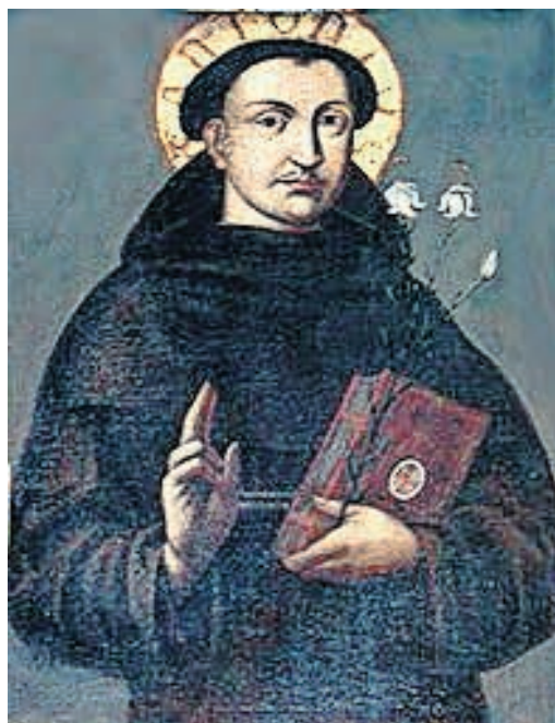
Heiliger Antonius in der Hofkirche Innsbruck