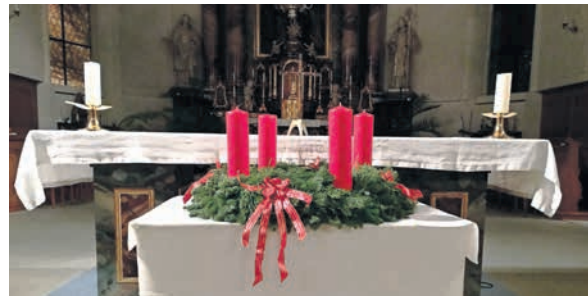
Adventskranz in der Pfarrkirche Wohlen

Die vierte Kerze verkörpert den Frieden und hat den Namen „Kerze der Engel“. Die Engel verkündeten, dass Jesus kam um Frieden zu bringen. Er kam, um die Menschen näher zueinander und zu Gott zu bringen.