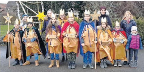
Sternsinger Leibstadt 2020

Unsere Sternsinger werden auch 2021 in beiden Pfarreien unterwegs sein und die Menschen besuchen. In Leibstadt sind sie am Samstag, 9. Januar ab 14 Uhr unterwegs.