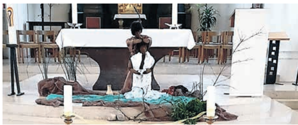
Taufe Jesu im Jordan, Figuren-Stellgruppe, Brugg