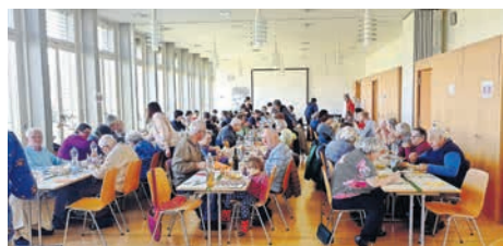
Ökumenische Fastensuppe 2019 in unserem Kirchenzentrum

Wir teilen Gemeinschaft und essen miteinander Suppe – sofern wir dies bis am 10. März wieder dürfen. Eine Anmeldung ist unbedingt erforderlich bis spätestens 8. März unter Tel.-Nr.: 056 443 00 20 (wenn Telefon nicht besetzt, bitte aufs Band sprechen). Wir sind noch am «Austüfteln», auf welche Art wir trotzdem Suppe teilen können, wenn das gemeinsame Zusammensitzen bis dann noch nicht wieder erlaubt ist. Ab dem 8. März teilen wir über den Telefonbeantworter mit, ob und wie unsere Suppe stattfindet. Euer KiZ-Team