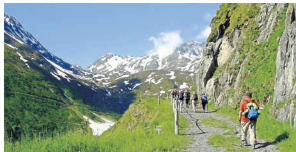
Pilgergruppe unterwegs zwischen Disentis und Andermatt, 2019

Am 24./25. September und 22./23. Oktober wandert die ökumenische Pilgergruppe wieder weiter auf dem Rhein-Reuss-Rhone-Weg (Jakobsweg).