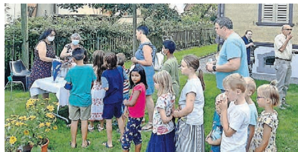
Grosser Andrang beim Hotdog-Stand!

Am Samstag, 21. August konnte bei wunderbarem Sommerwetter Neustart gefeiert werden: Der Schuleröffnungsgottesdienst für Brugg und Windisch begann mit einer gemütlichen Ankommerrunde im Freien. In der Gottesdienstfeier wurden die anwesenden Kinder in die Rolle der ersten Jünger