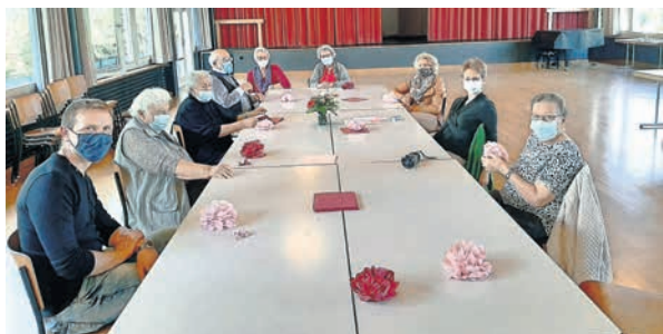
Treffen am 25. Mai 2021 im ref. Kirchgemeindehaus

Am Donnerstag, 16. September findet wieder das Treffen für Verwitwete und Alleinstehende statt. Das Caffè Compagnia bietet die Gelegenheit zum Erfahrungsaustausch und zu Gesprächen über Gott und die Welt. Das ökumenische Treffen findet dieses Mal um 14.30 Uhr im kath. Kirchenzentrum statt.