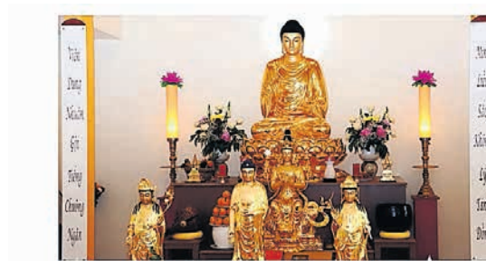
In der Schweiz leben ca. 6'000 Buddhisten.

Die Kolpingfamilie lädt alle zu einem Themenabend ein. Prof. Stephan Leimgruber vermittelt Informationen zum Buddhismus und zieht Vergleiche mit dem Christentum. Am Mittwoch, 15. September um 19.30 Uhr im Untergeschoss der kath. Kirche St. Nikolaus in Brugg.