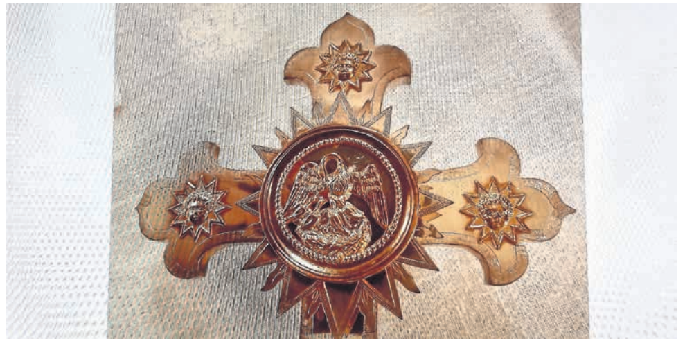
Reliquienkreuz Papst Pius X