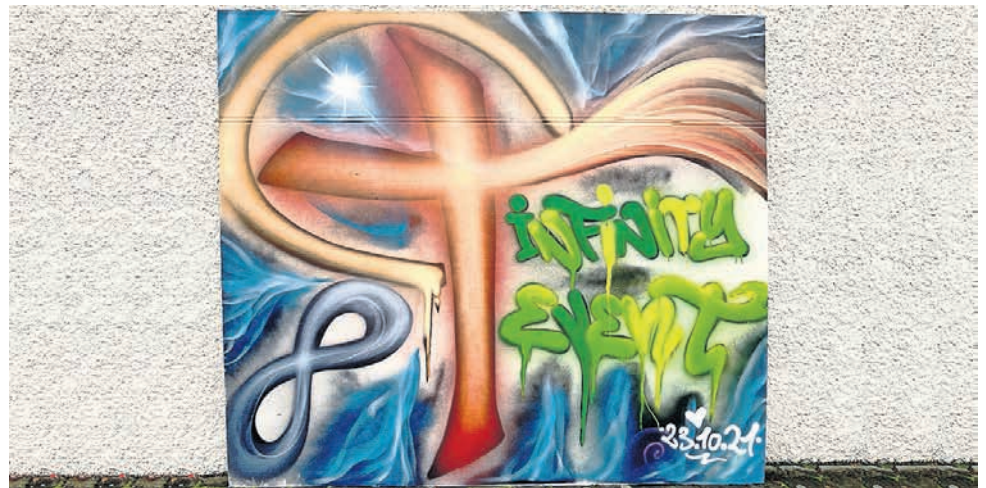
Das Infinity-Event-Graffiti des Künstlers Raphael Fahrni.

Am Samstag, 23. Oktober 2021 fand in Brugg, Windisch, Riniken, Birr und Schinznach-Dorf der Infinity-Jugendevent statt, zu dem die katholische Kirche Jugendliche aus der ganzen Region eingeladen hatte.